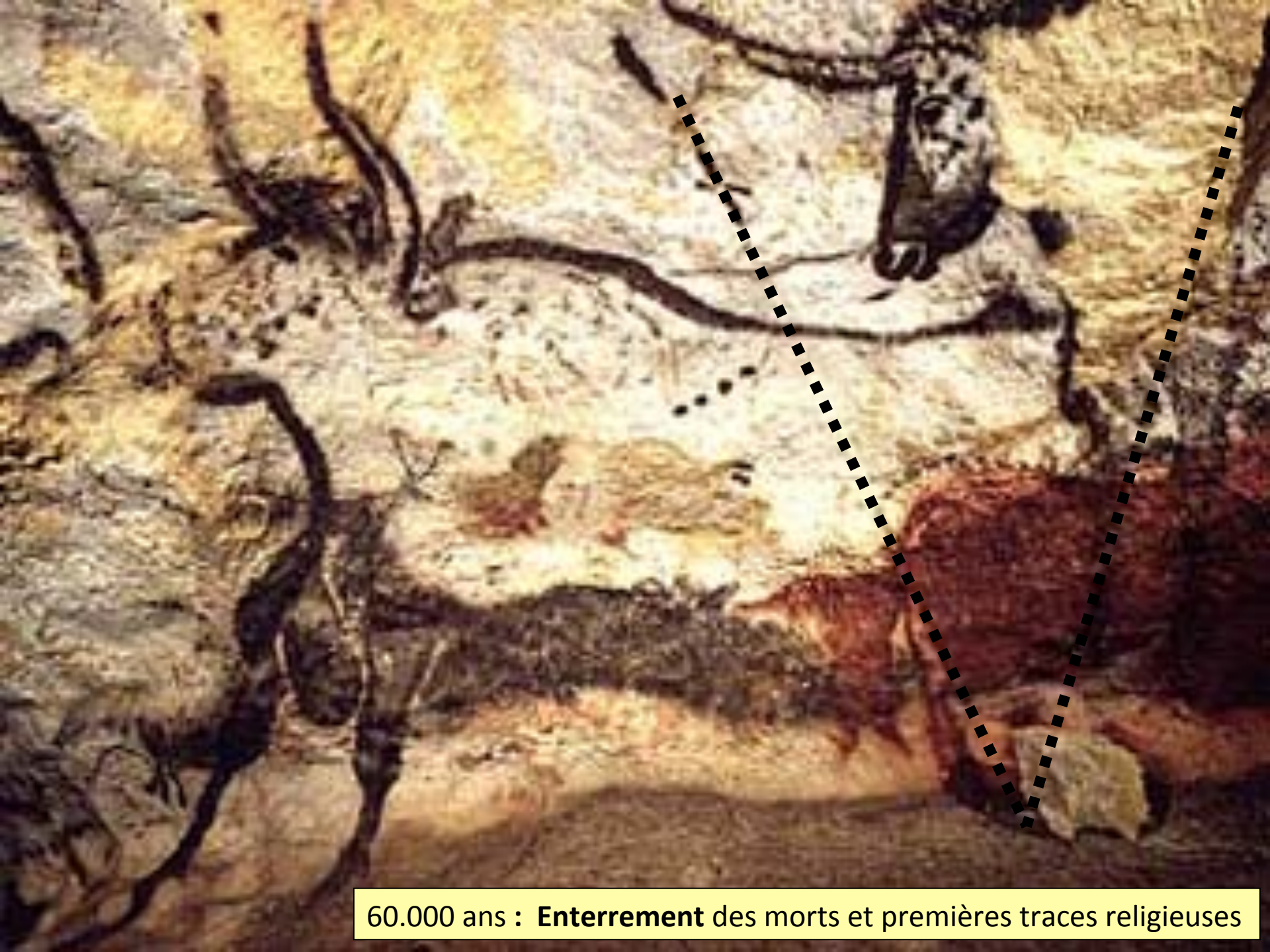
60.000 ans : Enterrement des morts et premières traces religieuses